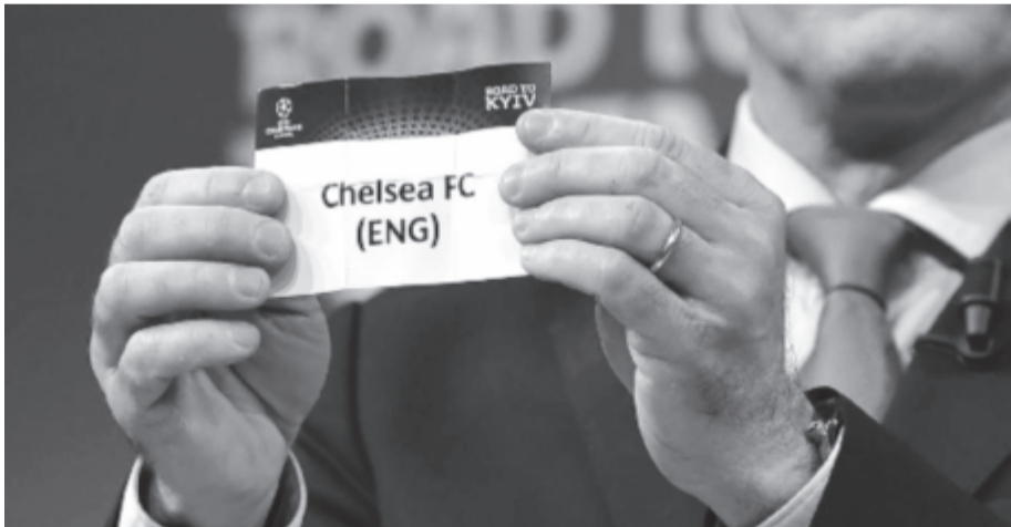
A londoni Kékek az utóbbi években a Bajnokok Ligájához „szoktak”, a második számú kupasorozatban 2013 után kényszerültek újra indulni

Magyar csapat legutóbb hat éve szerepelt főtáblán az európai porondon, a 2012/13-as idényben ugyancsak a Vidi és szintén a második számú nemzetközi kupában: akkor a belga Genk és a svájci Basel mögött, a portugál Sporting Lisszabont megelőzve csoportja harmadik helyén zárt.