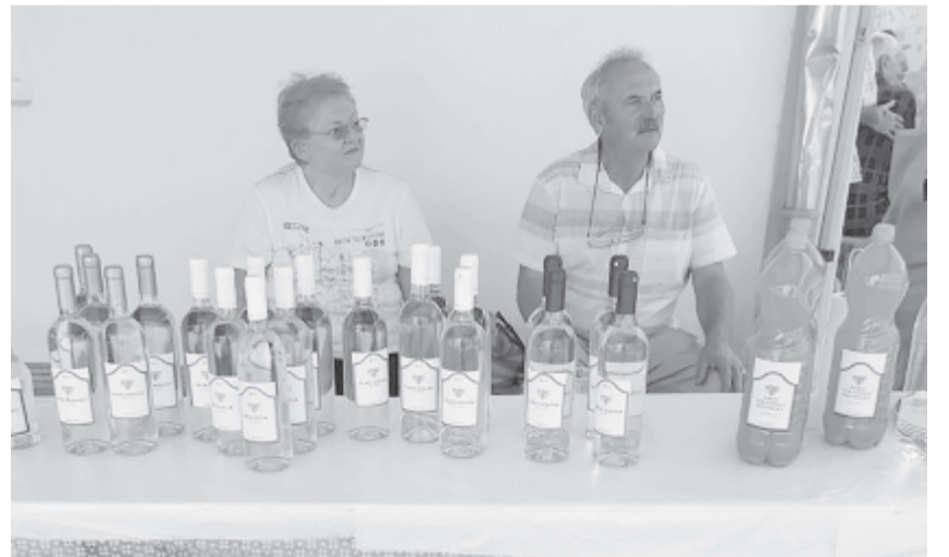
A közszénapok célja a szórakozás mellett a helyi termékek, értékek bemutatása.