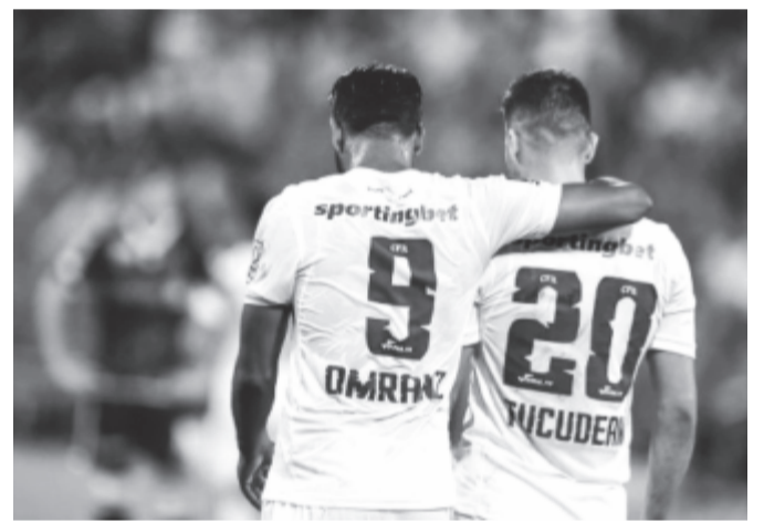
Lehajtott fővel: a luxemburgiaktól elszenvedett kettős vereséget a szakma a román labdarúgás mindenkori legsúlyosabb vereségének minősítette

* nem bajnoki ág: Ufa (orosz) – Rangers (skót) 1-1, továbbjutott: a Rangers, 2-1-es összesítéssel; AEK Larnaca (ciprusi) – Trencsén (szlovák) 3-0, továbbjutott: az AEK Larnaca 4-1-es összesítéssel; Lipcse (német) – Zorja Luhanszk (ukrán) 3-2, továbbjutott: a Lipcse 3-2-es összesítéssel; Apollon Limassol (ciprusi) – Basel (svájci) 1-0, továbbjutott: az Apollon 3-3-as összesítéssel, idegenben szerzett gólokkal; Maccabi Tel-Aviv (izraeli) – Sarpsborg (norvég) 2-1, továbbjutott: a Sarpsborg 4-3-as összesítéssel; Koppenhága (dán) – Atalanta (olasz) 0-0 – 11-esekkel 4-3, továbbjutott: a Koppenhága 0-0-s összesítéssel, tizenegyesekkel; Besiktas (török) – Belgrádi Partizan (szerb) 3-0, továbbjutott: a Besiktas 4-1-es összesítéssel; FCSB (román) – Bécsi Rapid (osztrák) 2-1, továbbjutott: a Rapid 4-3-as összesítéssel; Brøndby (dán) – Genk (belga) 2-4, továbbjutott: a Genk 9-4-es összesítéssel; Bordeaux (francia) – Gent (belga) 2-0, továbbjutott: a Bordeaux 2-0-s összesítéssel; Burnley (angol) – Olympiakosz Pireusz (görög) 1-1, továbbjutott: az Olympiakosz 4-2-es összesítéssel; Sevilla (spanyol) – Sigma Olomouc (cseh) 3-0, továbbjutott: a Sevilla 4-0-s összesítéssel.